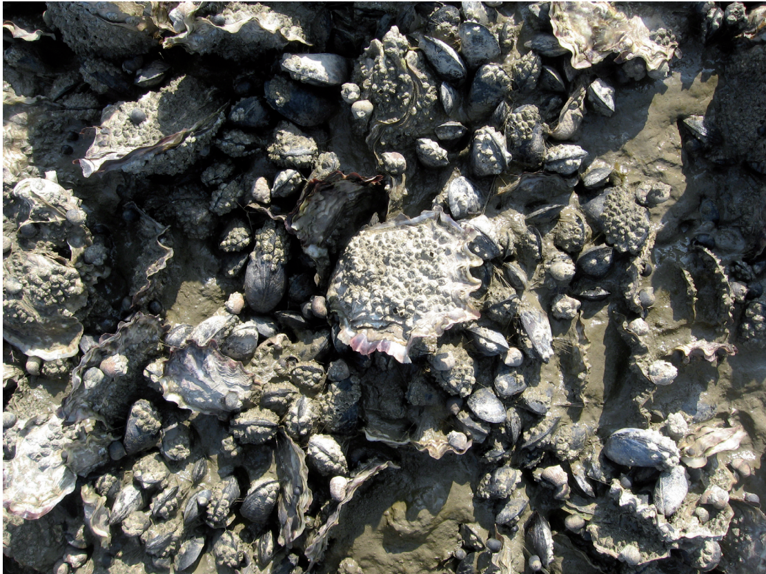
Abb. 5: Miesmuscheln und Pazifische Austern in Koexistenz

mit Austern besetzt sind. Im Jahre 2007 blieb erstmals seit Einwanderung der Art ein Austerbrutfall in Niedersachsen aus. Eine Prognose über die weitere Entwicklung des Lebensraumes Miesmuschelbank bzw. Muschelbank ist nicht möglich, zurzeit zeichnet sich eine Koexistenz beider Muschelarten ab (s. Abb. 5).