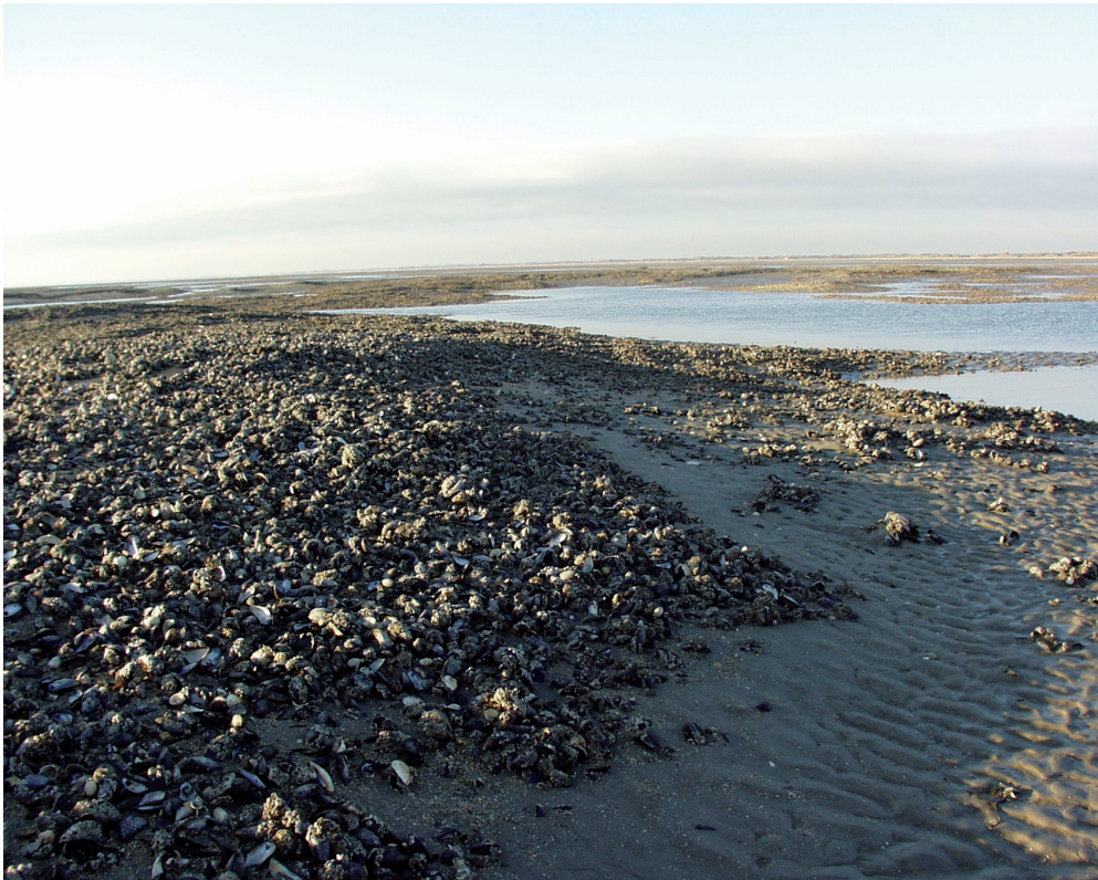
Abb. 2: Miesmuschelbank im Langeooger Rückseitenwatt