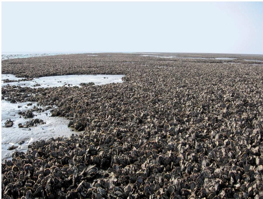
Abb. 4: Dichtes Austernvorkommen auf dem Randzel (Borkumer Watt)

Ausbreitung der invasiven Art konnte kontinuierlich bis heute im Rahmen des Miesmuschelmonitorings (HERLYN and MILLAT [2004]) sowie eines Forschungsprojektes zur Bioinvasion der Pazifischen Auster (WEHRMANN et al. [2006]) dokumentiert werden.